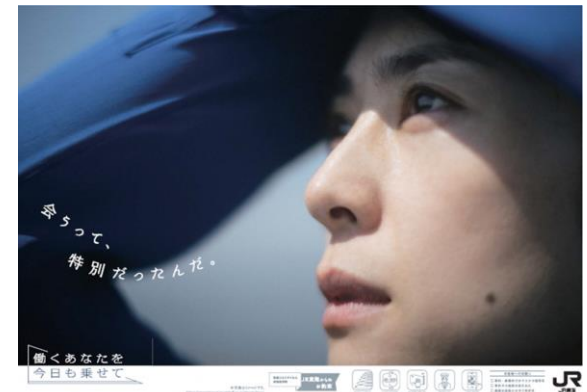
「会うって、特別だったんだ。」ポスター