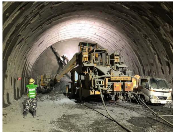
第四南巨摩トンネル (西工区)