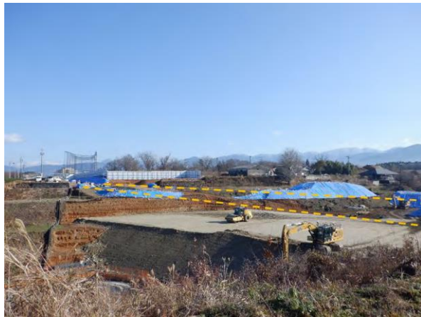
中部総合車両基地