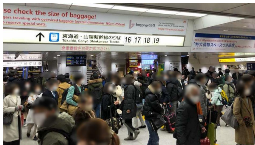
12/29 東京駅改札内の様子