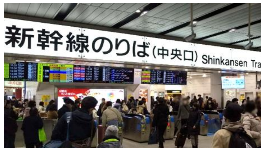
1/3 新大阪駅改札付近の様子