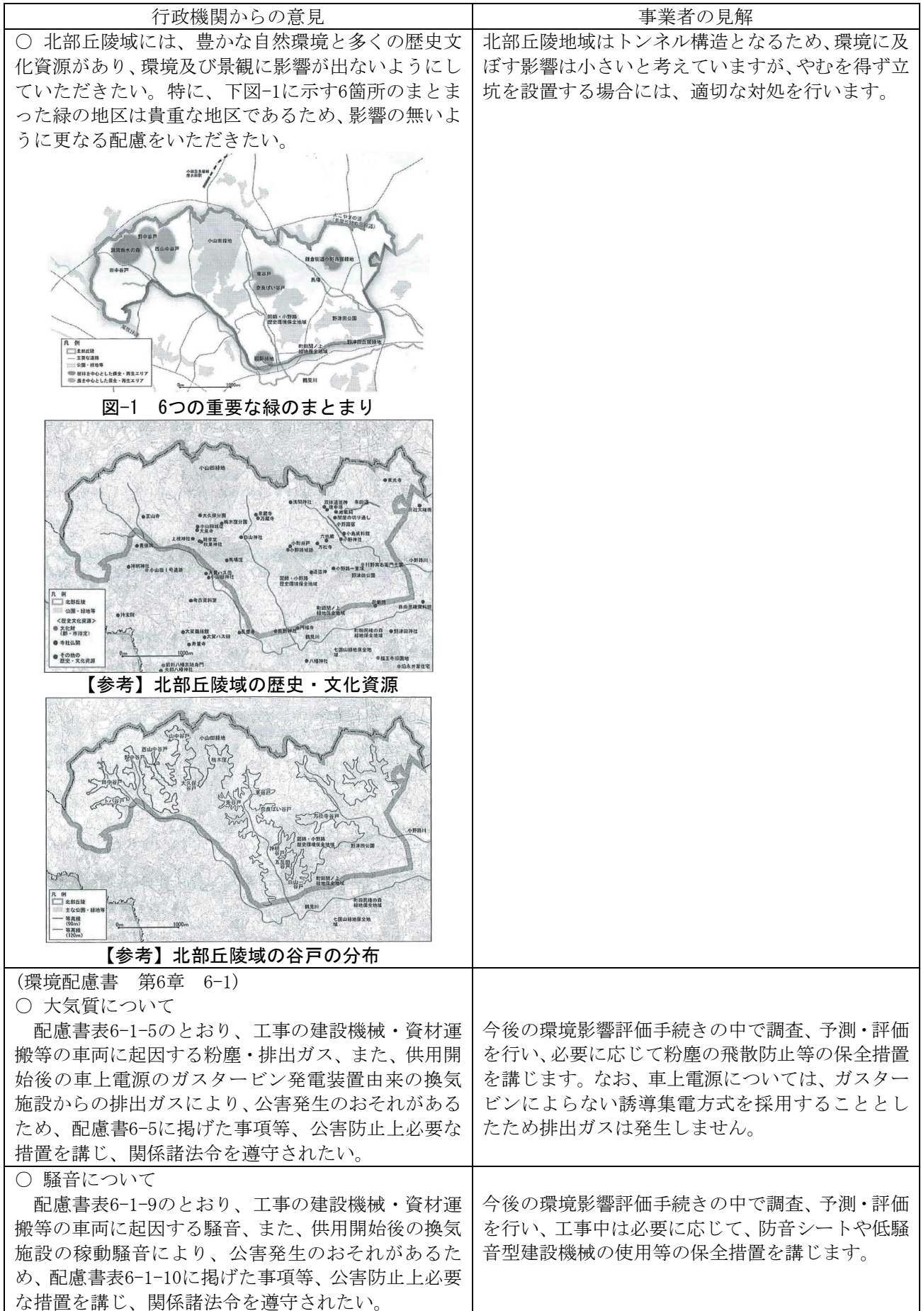
表 5-3-3-2(14) 行政機関からの意見と事業者の見解（地方自治体）