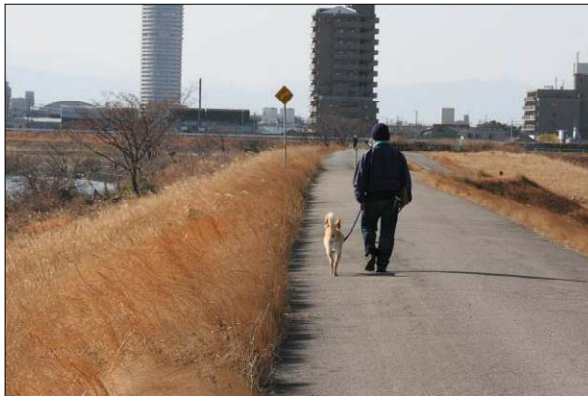
散歩・散策の状況