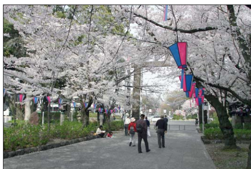
花見・散策の状況