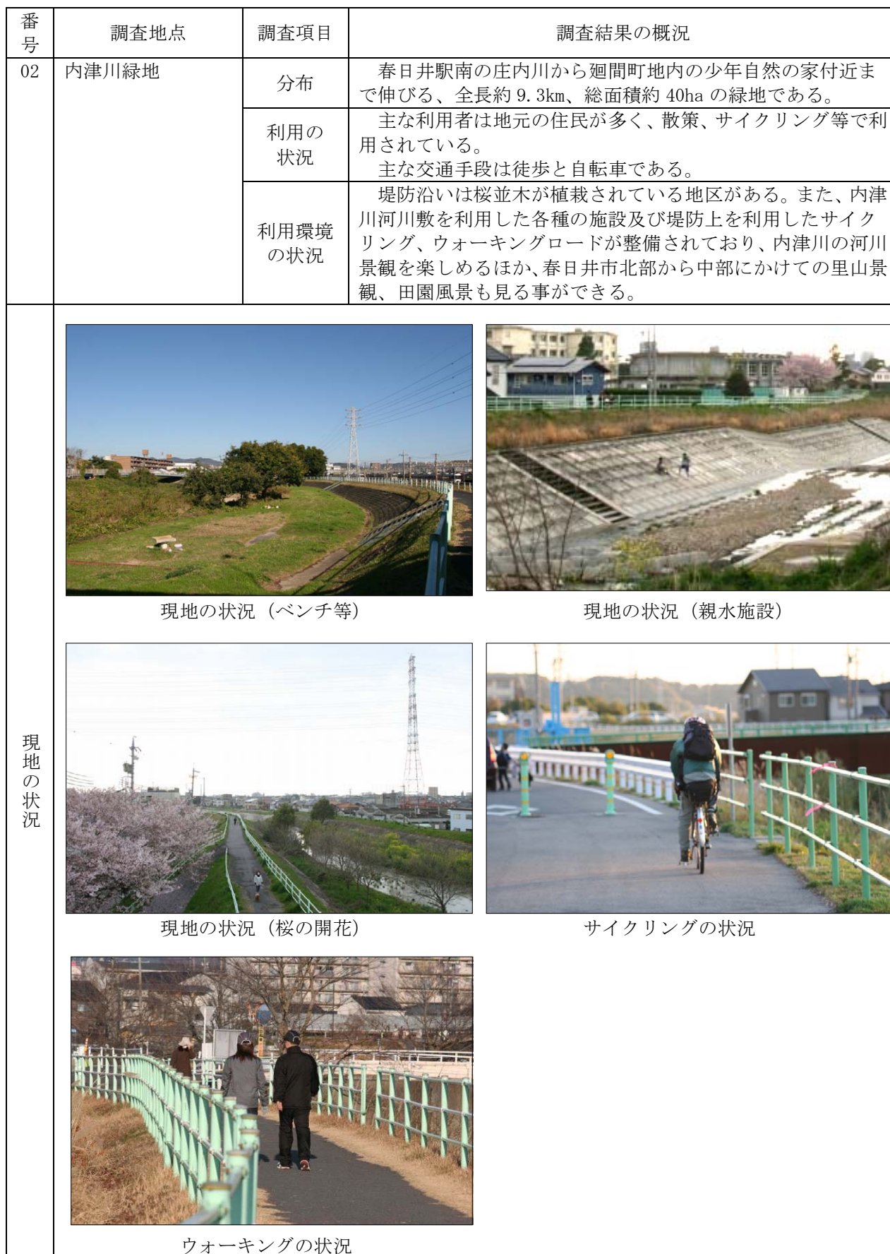
表 8-5-2-2(2) 主要な人と自然との触れ合いの活動の場の分布、利用の状況及び利用環境の状況