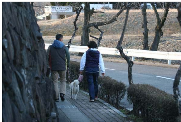
散歩・散策の状況