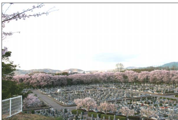
現地の状況（桜の開花）