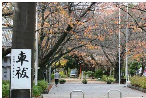
散歩・散策の状況