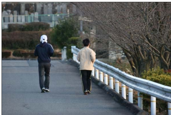
ジョギングの状況