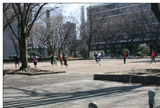
レクリエーションの状況