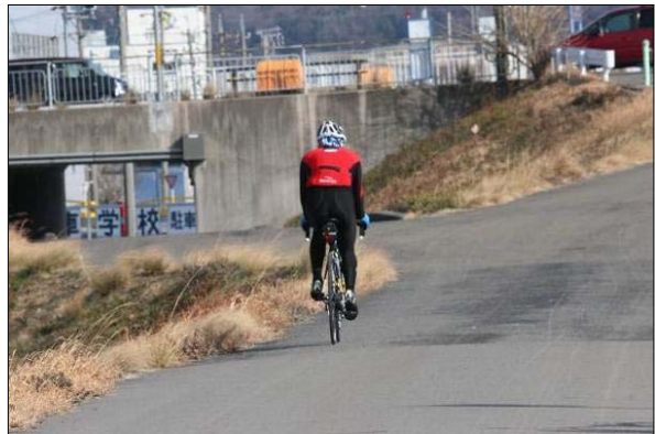
サイクリングの状況