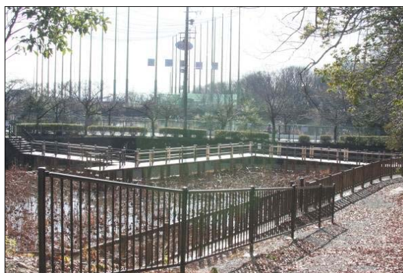
現地の状況（蓮池（閉鎖中））