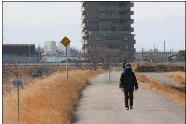
ウォーキングの状況