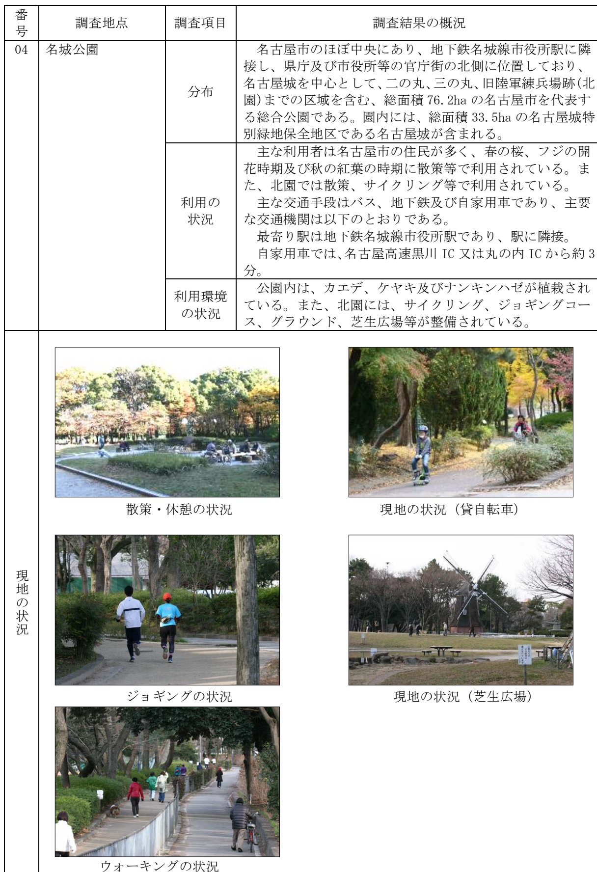
表 8-5-2-2(4) 主要な人と自然との触れ合いの活動の場の分布、利用の状況及び利用環境の状況