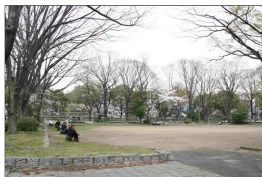
休息・休憩の状況