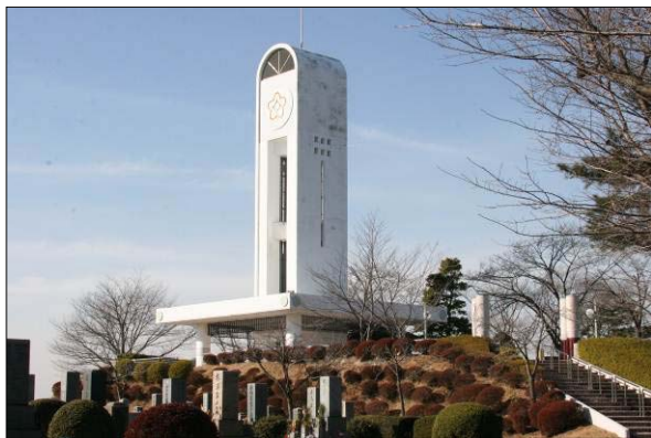
現地の状況（展望台）