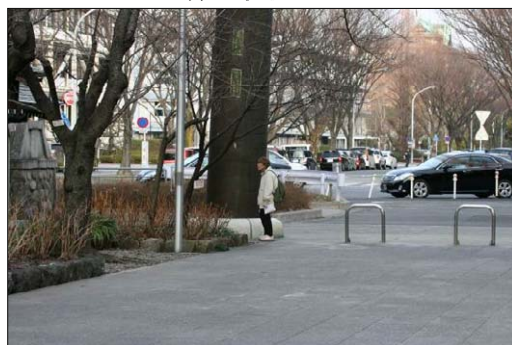
散歩・散策の状況