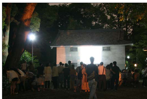
ヒメボタル観察会の状況