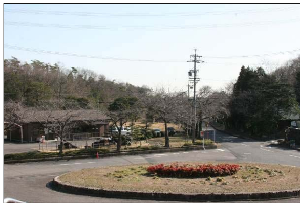
現地の状況（管理事務所及び花壇）