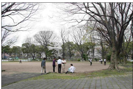
レクリエーションの状況