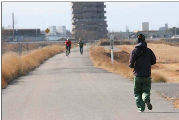
ジョギングの状況